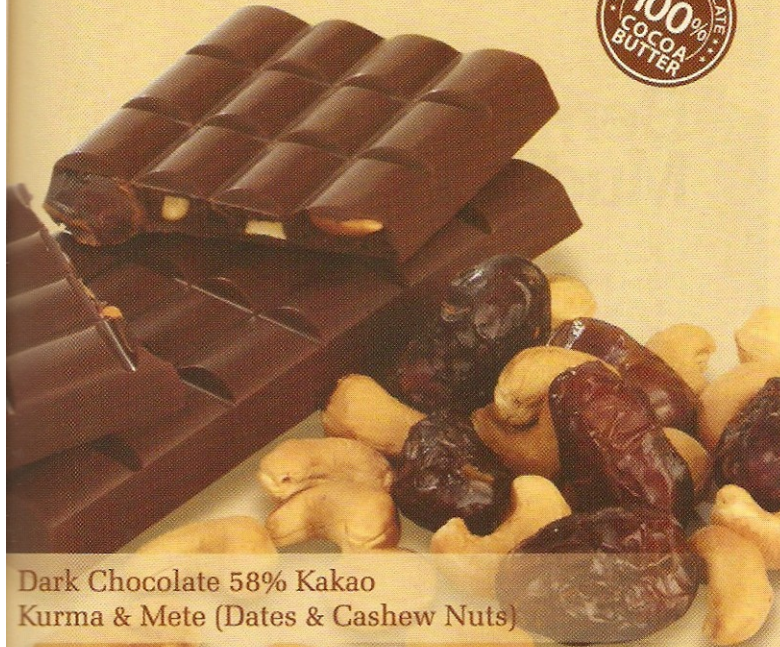
Dark Chocolate 58% Kakao Kurma & Mete (Dates & Cashew Nuts)